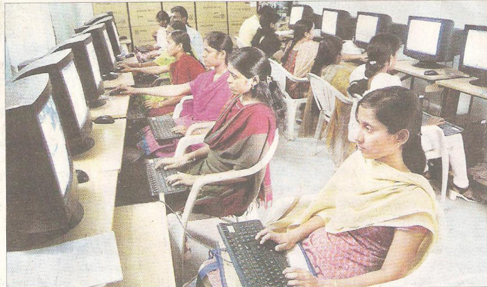
కంప్యూటర్ శిక్షణ పొందుతున్న నిరుద్యోగులు

నిరుపేద యువతీ యువకులను ఎంచుకొని మార్కెట్లో డిమాండ్ ఉన్న కోర్సుల్లో వారికి ఉచితంగా శిక్షణ ఇచ్చి ఉపాధి చూపిస్తోంది ఆ సంస్థ. తమ క్యాంపై తాము నిలబడలా చేయడం చిన్నపనేమీ కాదు. అంతటి సదాశయంతో ముందుకెళ్ళాంది. కంప్యూటర్ ఆధారిత కోర్సులతో పాటు మంచి ఉపాధి, ఉద్యోగా వకాశాలన్న కోర్సుల్లో నిరుద్యోగ యువతకు, గృహిణులకు తర్కీదునిస్తోంది. ఒడిదుడుకులను ఎదుర్కొని స్ఫూర్తిదాయకంగా నిలిచేలా మలుస్తోంది. డాక్టర్ రెడ్డీస్ ఫౌండేషన్, క్షత్రియ రాజపుత్ ట్రస్టులో(మహారాజా ప్రతాప్ సోస్టేట్)ల సంయుక్త ధర్మంలో అంబర్పేట ఛేసంబర్లో ఉచిత శిక్షణ కేంద్రాన్ని ప్రారంభించింది. ఏడాది క్రితం ప్రారంభమైన ఈ శిక్షణలో ఇప్పటి వరకు 352 మంది అభ్యర్థులు నాలుగు బ్యాచ్లలో శిక్షణ పొందారు.